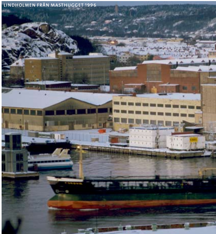
LINDHOLMEN FRÅN MASTHUGGET 1996